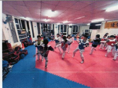
建宏道館移地訓練過程