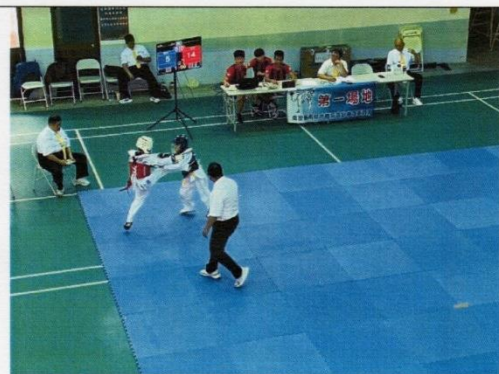
全民盃對練比賽過程