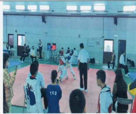
中小聯運對練比賽過程