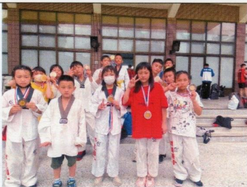
參加112年南投縣全民盃跆拳道競賽