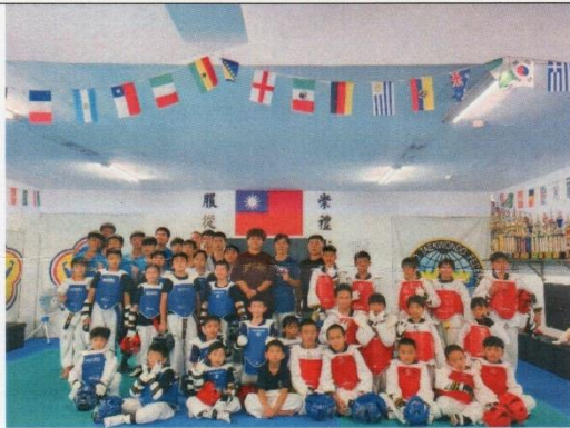
台中大同道館進行友誼賽