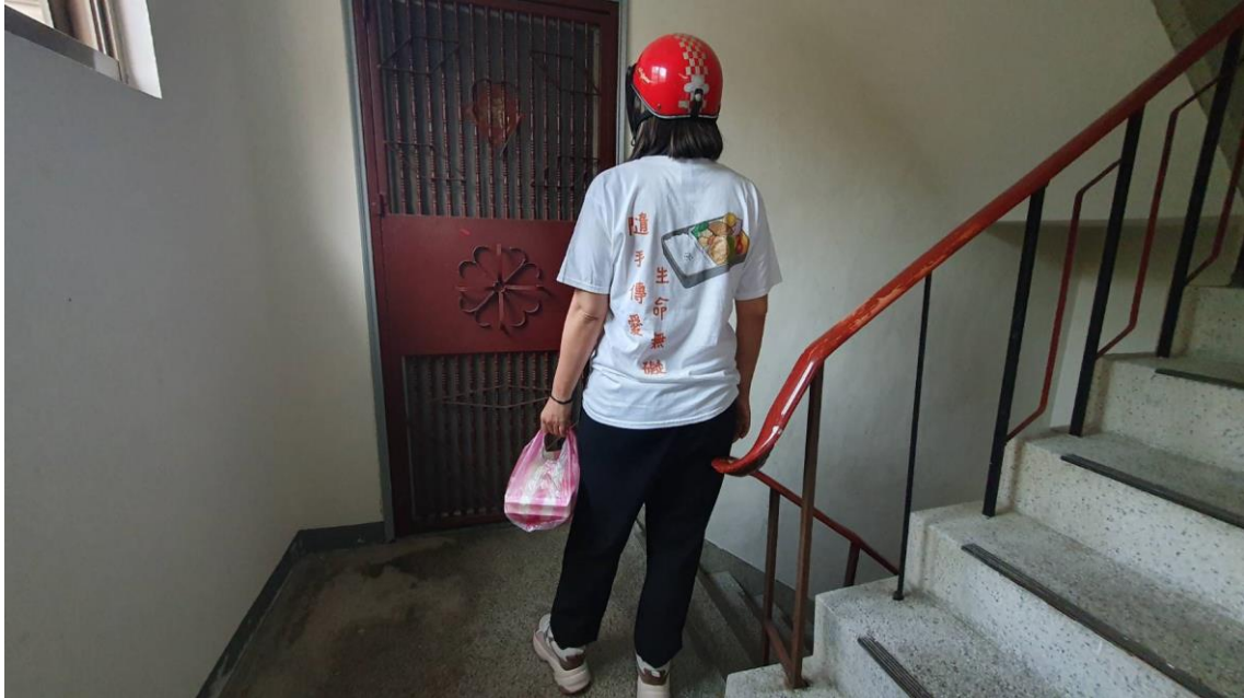
台北市 大安區 紅橘子連鎖早餐 延吉店

新增七家"傳愛食堂"合作店家，提供十八歲以下、七十歲以上遇有急難狀況者免費取用餐點。另直接補助台中惠明教養院、台東仁愛之家計逾250人。